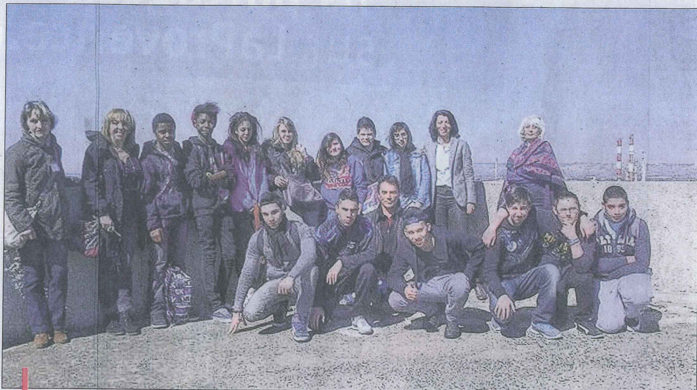
Les lycéens ont eu l'opportunité de découvrir un environnement peu commun, ce qui les a surpris.